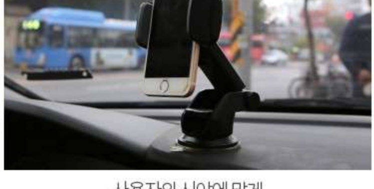
고정 레버를 내려 2중 흡착해줍니다.