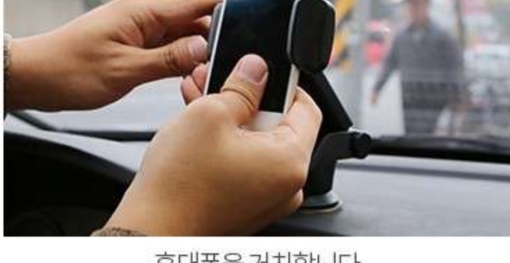
설치 위치에 거치대를 부착합니다.